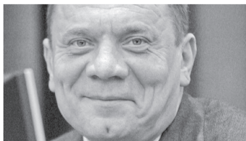
Заместитель министра обороны РФ Юрий Борисов:

Ил-78М-90А позволит производить одновременную заправку двух самолетов фронтовой авиации (типа Су-27, МиГ-29) с использованием агрегатов заправки, установленных на крыле. С хвостового агрегата заправки будет возможность заправлять самолеты дальней и специальной авиации.