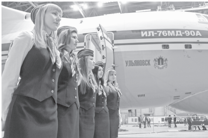
В рост индекса промпроизводства области весомым вкладом стала передача заказчику первого Ил-76МД-90А производства «Авиастар-СП», получившего имя «Ульяновск».

Не на высшем уровне оказались развитие сельского